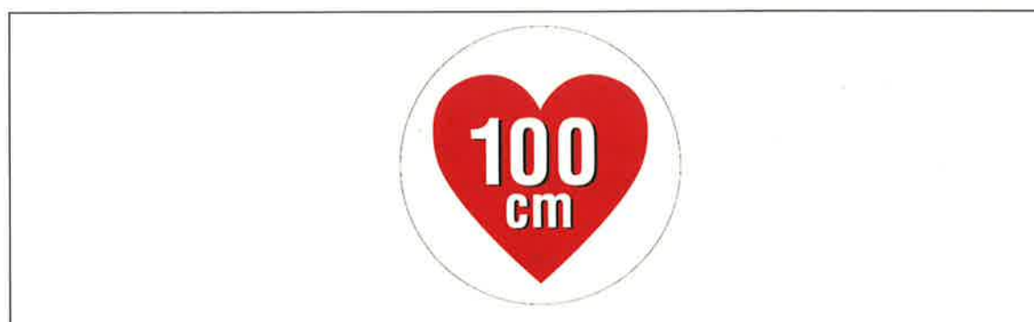
図2 据置きタイプRFID機器（高出力型950MHz帯パッシブタグシステム）用ステッカ

注1：ここでは、公共施設や商業区域などの一般環境下で使用されるRFID機器を対象としており、工場内など一般人が入ることができない管理区域でのみ使用されるRFID機器（管理区域専用RFID機器）については対象外としている。なお、管理区域専用RFID機器については、（一社）日本自動認識システム協会において、一般環境への流出を防止するため、取扱説明書等に注意書きを記載するとともに、管理区域専用RFID機器用ステッカ（図3）を貼付することとされている。