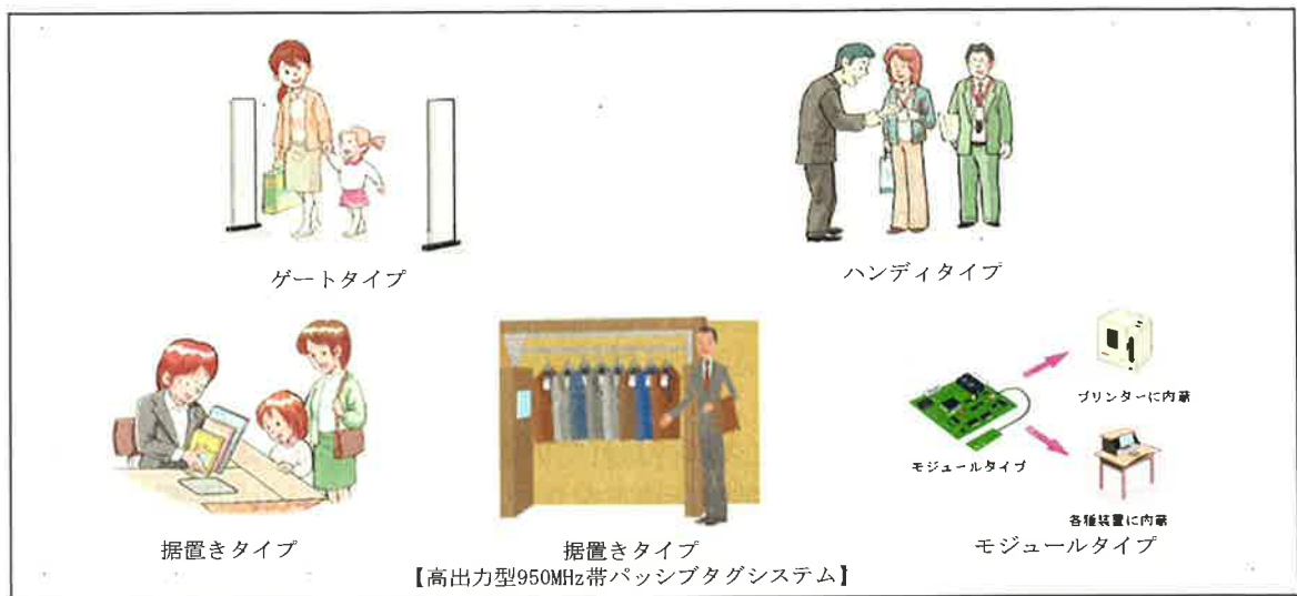
図4 各タイプのRFID機器

注3： 比較的長距離の通信が可能なUHF帯（950MHz帯）の電波を利用するRFID機器。 例えば、コンテナやパレットなどに貼付したタグの一括読み取り等のアプリケーションに使用されることが想定される。